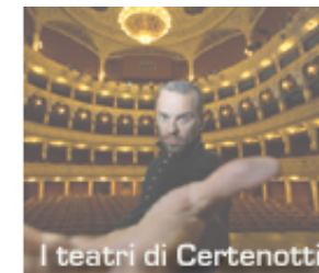
I teatri di Certenotti